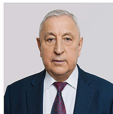
ХАРИТОНОВ НИКОЛАЙ МИХАЙЛОВИЧ

1948 года рождения; место жительства – город Москва; Государственная Дума Федерального Собрания Российской Федерации, депутат, председатель Комитета Государственной Думы по развитию Дальнего Востока и Арктики; выдвинут политической партией «Политическая партия «КОММУНИСТИЧЕСКАЯ ПАРТИЯ РОССИЙСКОЙ ФЕДЕРАЦИИ»; член политической партии «Политическая партия «КОММУНИСТИЧЕСКАЯ ПАРТИЯ РОССИЙСКОЙ ФЕДЕРАЦИИ», член Центрального Комитета партии, член Президиума Центрального Комитета партии