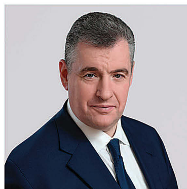
СЛУЦКИЙ ЛЕОНИД ЭДУАРДОВИЧ

1968 года рождения; место жительства – город Москва; Государственная Дума Федерального Собрания Российской Федерации, депутат, руководитель фракции Политической партии ЛДПР – Либерально-демократической партии России, председатель Комитета Государственной Думы по международным делам; выдвинут политической партией «Политическая партия ЛДПР – Либерально-демократическая партия России»; член политической партии «Политическая партия ЛДПР – Либерально-демократическая партия России», Руководитель Высшего Совета партии, Председатель партии